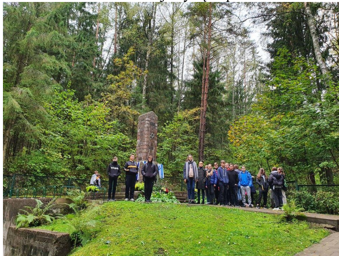
Pav. Ekskursija Krakynės miške