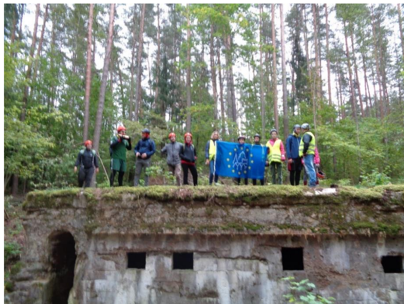
Pav. Bunkeris Turmanto seniūnijoje