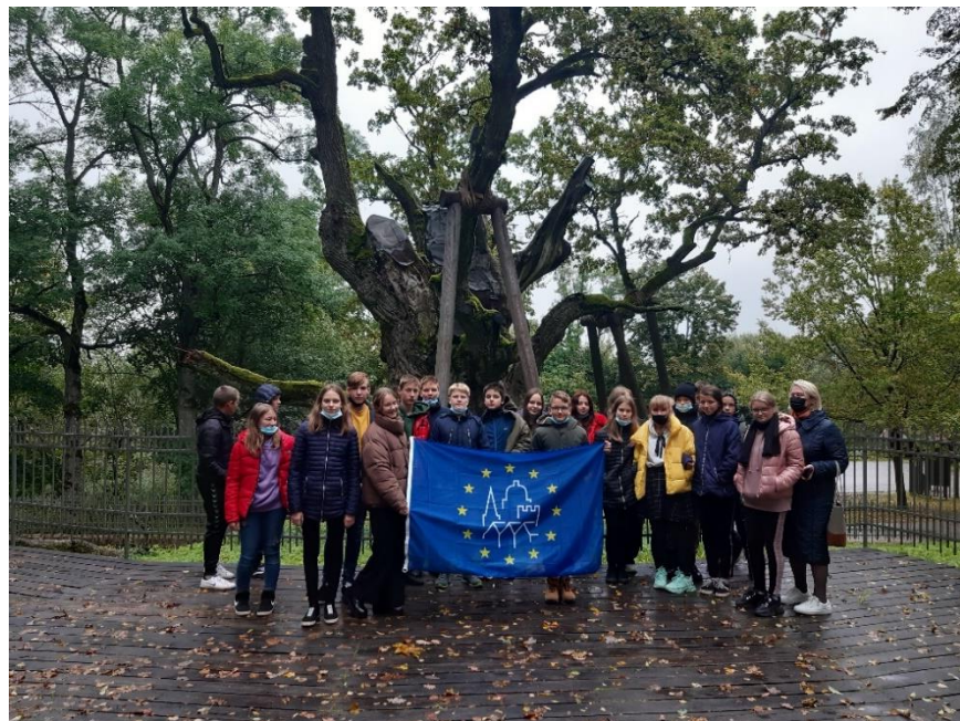
Pav. Zarasų Pauliaus Širvio progimnazijos moksleiviai prie Stelmužės ąžuolo