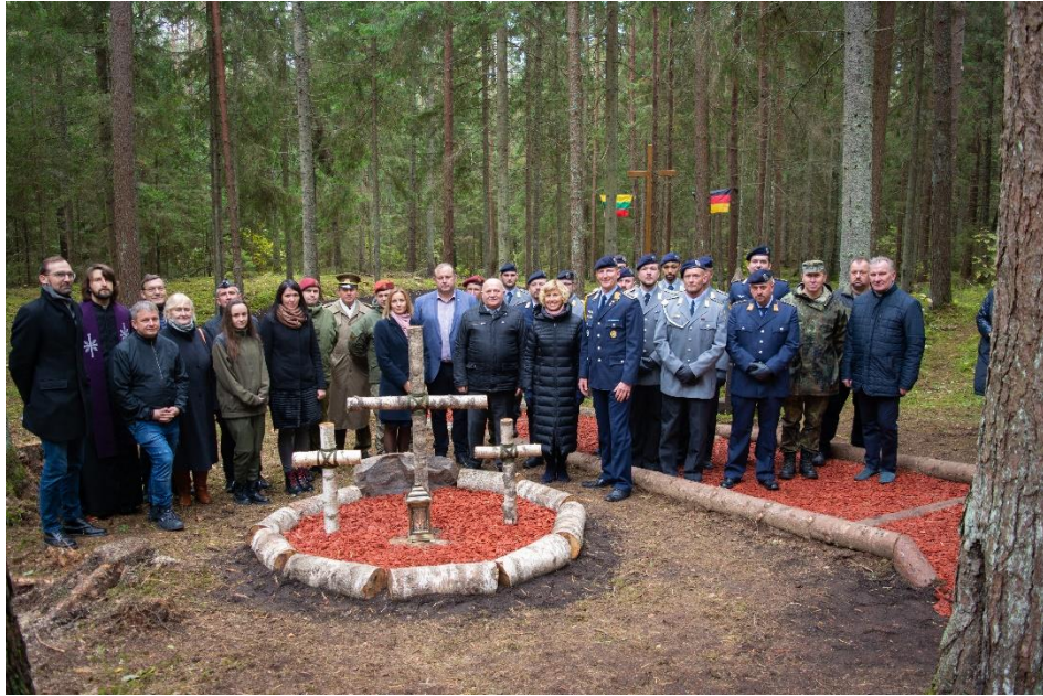
Pav. Vokiečių karių kapų globos tautinės sąjungos „Volksbundas“ kariai atliko Pirmo pasaulinio karo vokiečių karių kapų priežiūros darbus