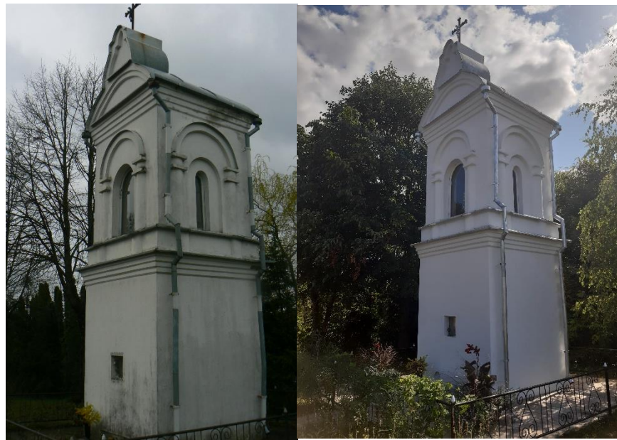
Pav. Koplytėlė, esančios Šaltupės g., iki priežiūros darbų ir po