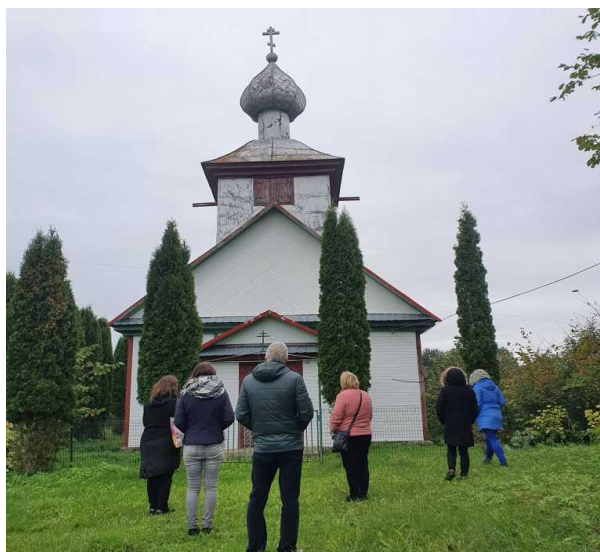
Pav. Ekskursija Degučių kaime prie sentikių cerkvės