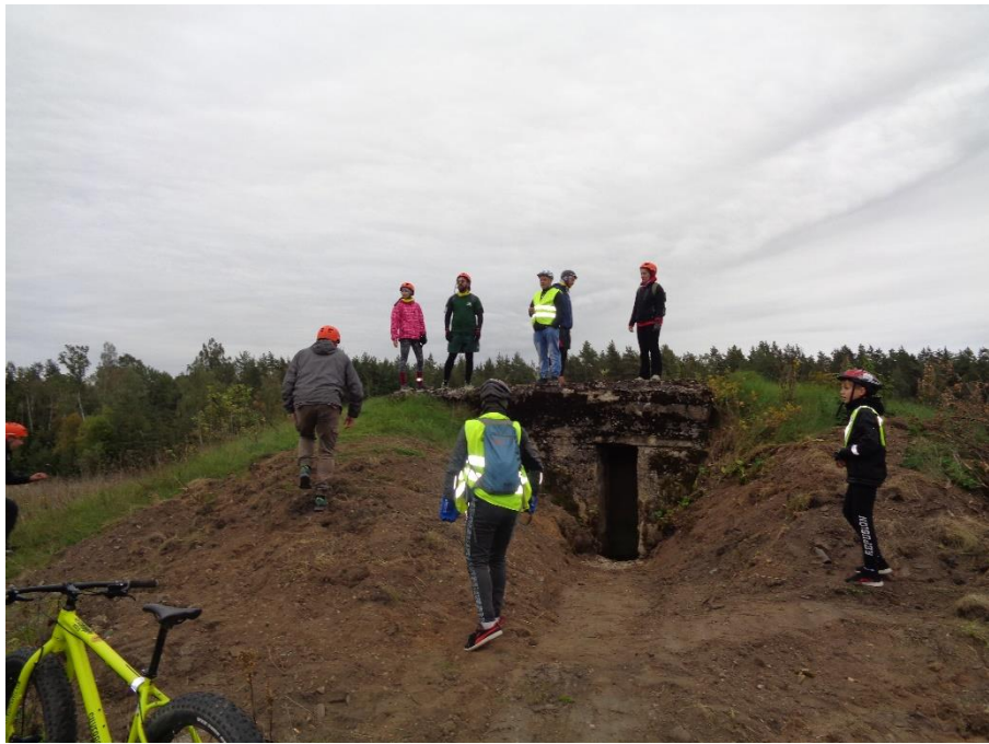
Pav. Bunkeris Turmanto seniūnijoje