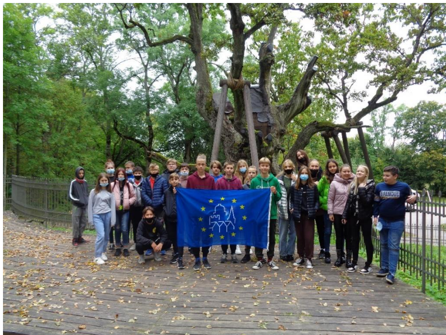
Pav. Zarasų Pauliaus Širvio progimnazijos moksleiviai prie Stelmužės ąžuolo