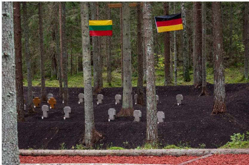
Pav. Pirmojo pasaulinio karo Vokietijos imperijos karių kapai, Gražutės k., Zarasų sen., Zarasų rajone