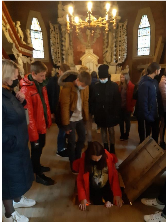
Pav. Zarasų Pauliaus Širvio progimnazijos moksleiviai Stelmužės Viešpaties Jėzaus Kryžiaus bažnyčioje