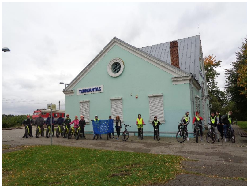
Pav. Žygis – ekskursija dviračiais Pirmojo pasaulinio karo pėdsakais, Turmanto seniūnija