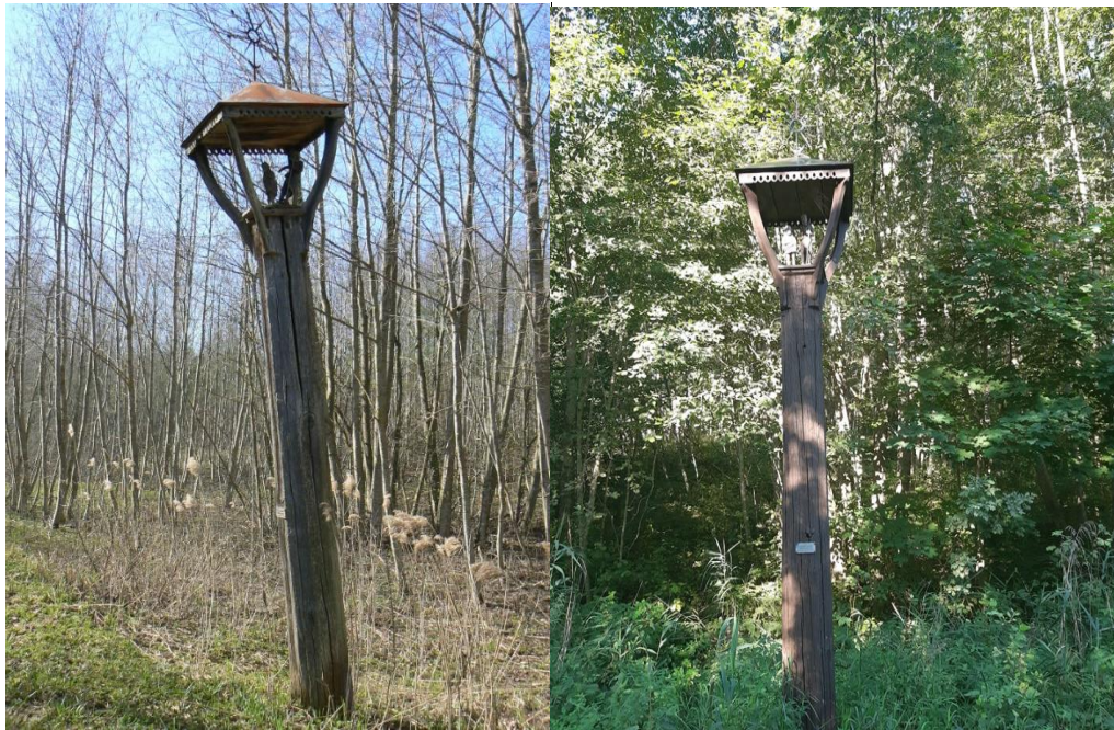
Pav. Naprelių koplytstulpis iki priežiūros darbų ir po