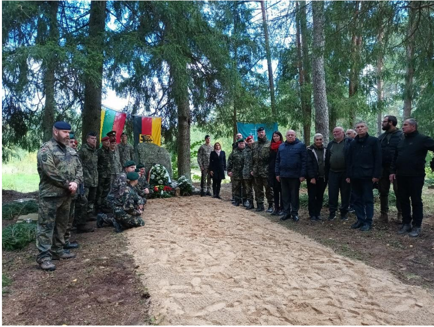
Pav. Minējimo akimirkos