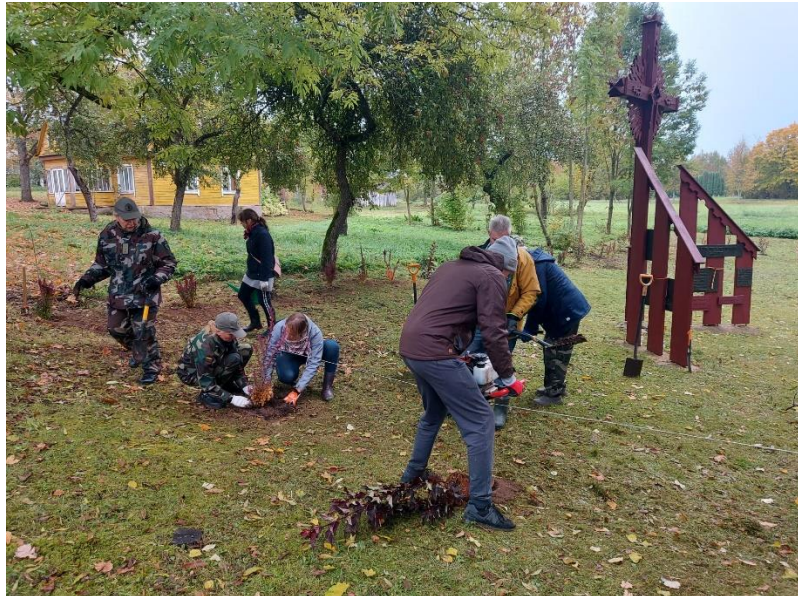
Pav. Kultūros paveldo teritorijos apželdinimo darbai - Lietuvos partizanų užkasimo vieta ir kapai (unikalus kodas Kultūros vertybių registre 38187).