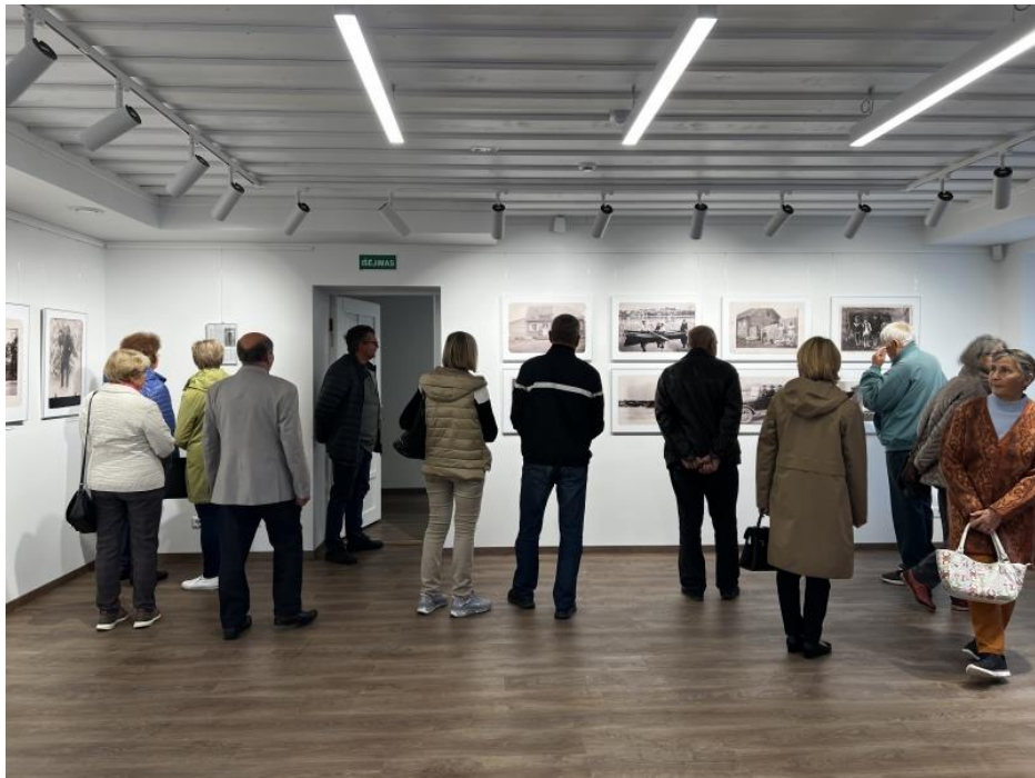
Pav. Ekskursija pastatą, esantį D. Bukonto g. 1, Zarasuose