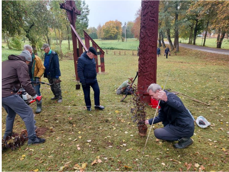
Pav. Kultūros paveldo teritorijos apželdinimo darbai - Lietuvos partizanų užkasimo vieta ir kapai (unikalus kodas Kultūros vertybių registre 38187)