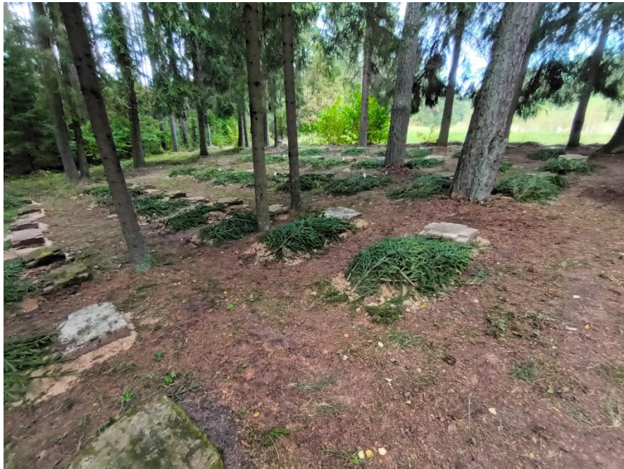
Pav. Vokiečių karių kapų globos tautinės sąjungos „Volksbundas“ kariai atliko Pirmo pasaulinio karo vokiečių karių kapų priežiūros darbus