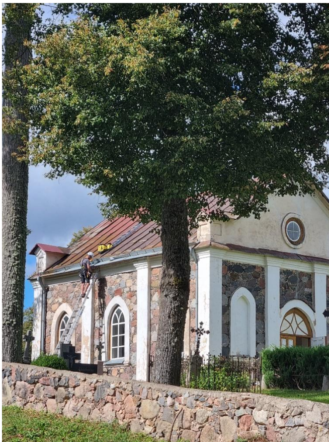
Pav. „FIXUS Mobilis“ komanda atlieka priežiūros darnu Antazavės kaimo kapinių koplyčioje