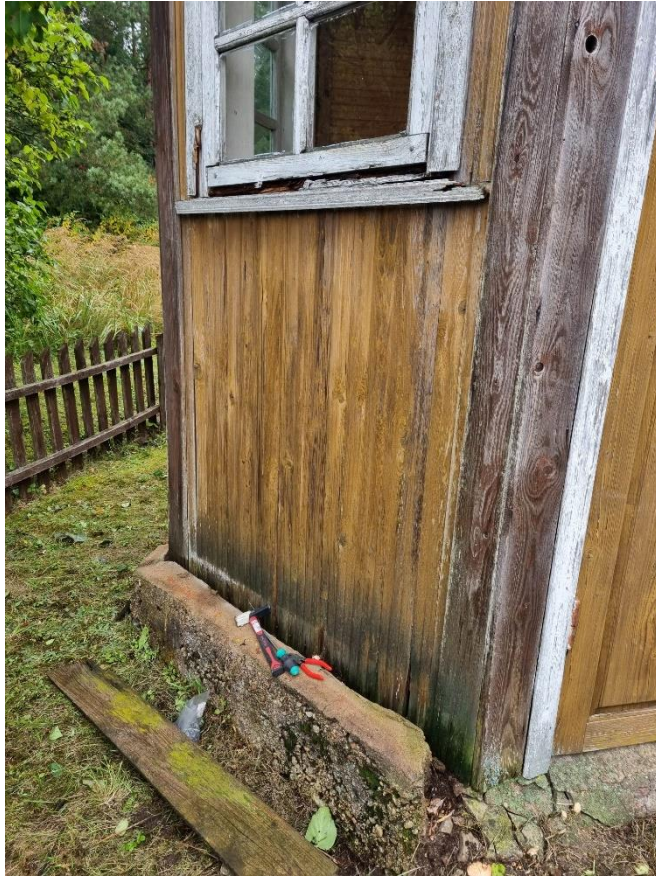
Pav. „FIXUS Mobilis“ komanda atlieka priežiūros darbus koplytėlėje (dviaukštė su ornamentuotu kryželiu, Nukryžiuotojo ir Rūpintojėlio skulptūromis) (Salako Šv. Jono Nepomuko koplyčia)