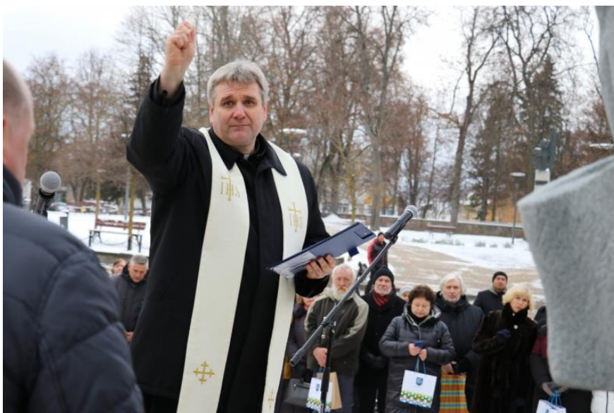
Pav. Paminklo šventinimo ceremonija