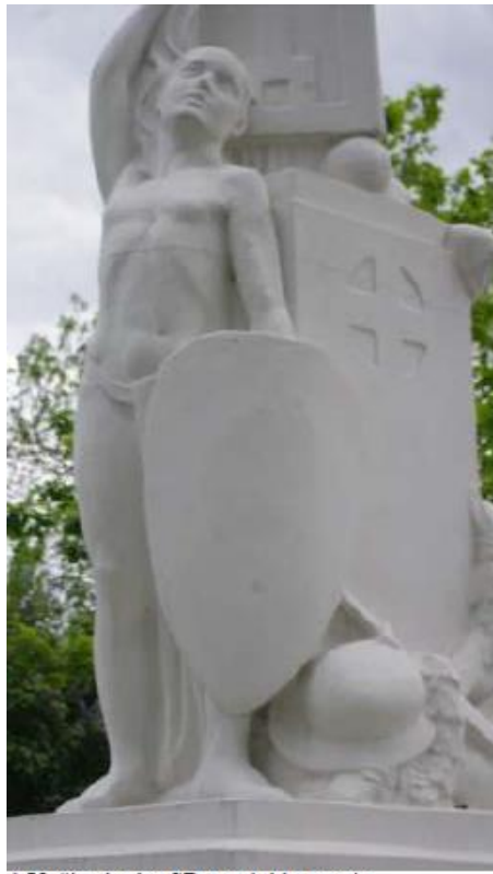
1. Vyčio skydas SR paminklo pusėje.