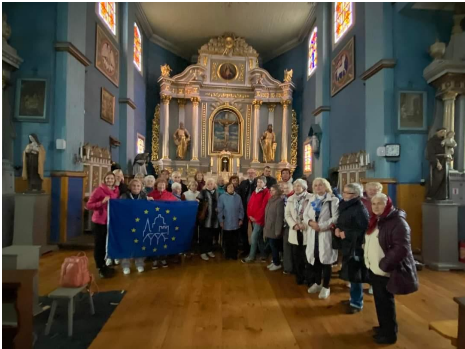
Pav. Europos paveldo dienos Antazavės Dievo Apvaizdos bažnyčioje