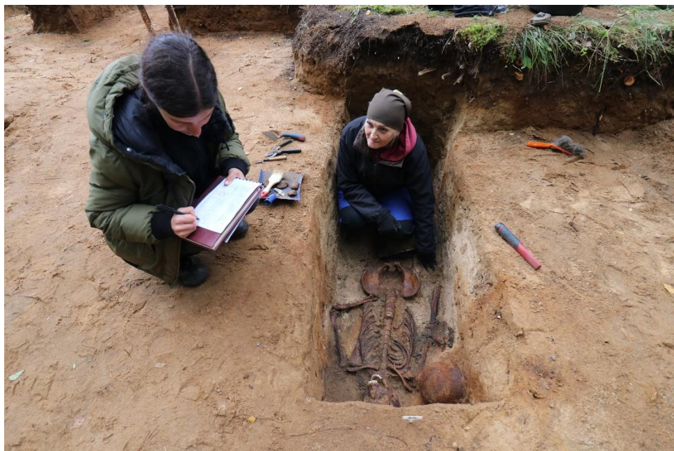
Pav. II-ojo pasaulinio karo vokiečių karių kapavietės Kunotų kaime (Zarasų r.) karių ekshumacijos darbai