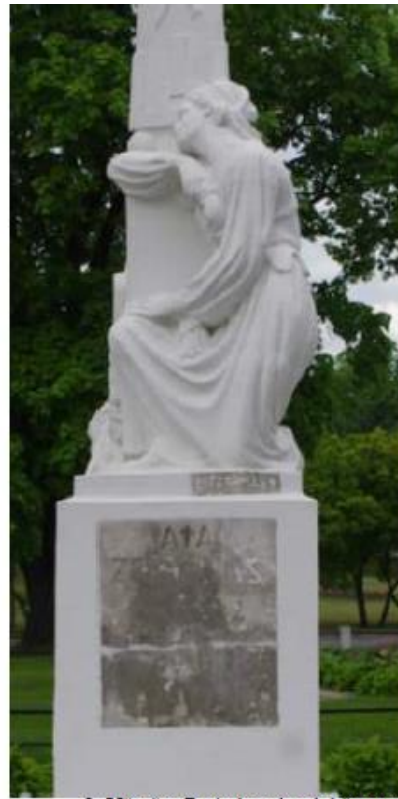
2. Užrašas P pjedestalo plokštumoje