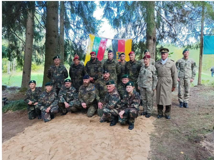
Pav. Minējimo akimirkos