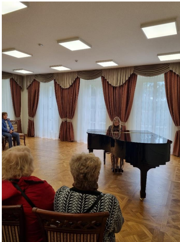
Pav. Europos paveldo dienos Antazavės dvare