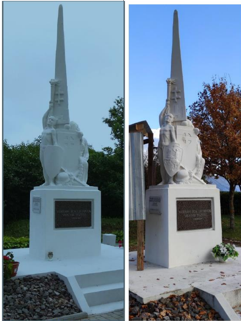
Paminklo bendras vaizdas prieš ir po restauravimo

Pav. Paminklas po restauravimo darbų – skyde atrestauruotas Vyties bareljefas