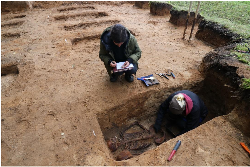
Pav. II-ojo pasaulinio karo vokiečių karių kapavietės Kunotų kaime (Zarasų r.) karių ekshumacijos darbai