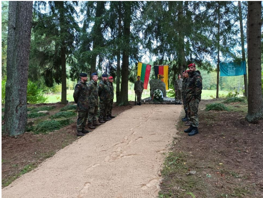
Pav. Vokiečių karių kapų globos tautinės sąjungos „Volksbundas“ kariai atliko Pirmo pasaulinio karo vokiečių karių kapų priežiūros darbus