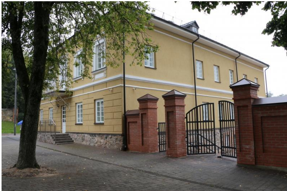
Pav. D. Bukonto g. 1, Zarasuose pastatas po tvarkybos darbų