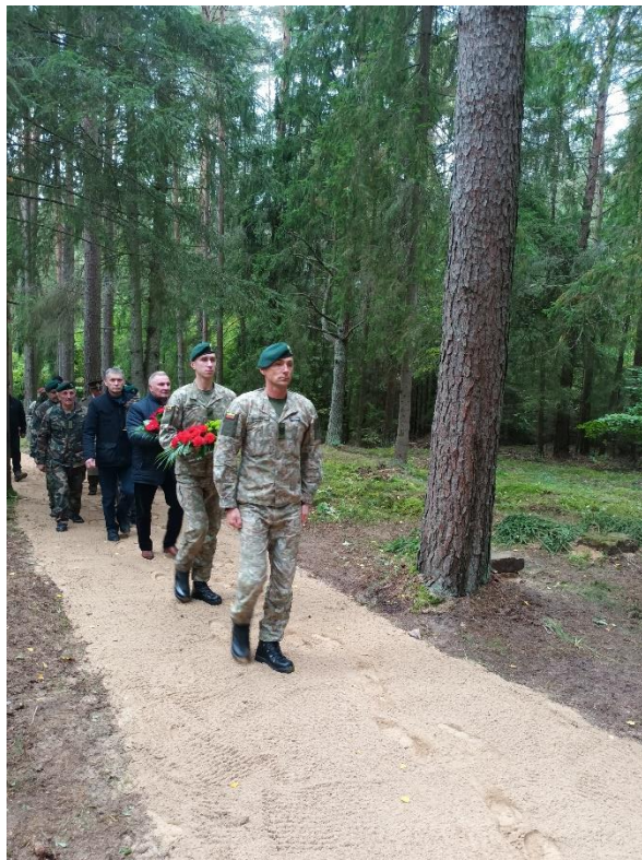
Pav. Pirmojo pasaulinio karo Vokietijos imperijos karių kapai, Šakių k., Turmanto sen., Zarasų rajone