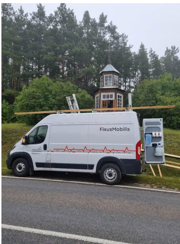
Pav. FIXUS Mobilis“ priežiūros darbai koplytėlėje (dviaukštė su ornamentuotu kryželiu, Nukryžiuotojo ir Rūpintojėlio skulptūromis) (Salako Šv. Jono Nepomuko koplyčia)