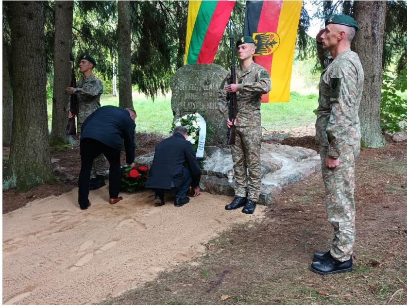
Pav. Pirmojo pasaulinio karo Vokietijos imperijos karių kapai, Šakių k., Turmanto sen., Zarasų rajone