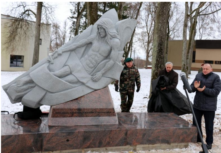
Pav. Paminklo atidengimo ceremonija