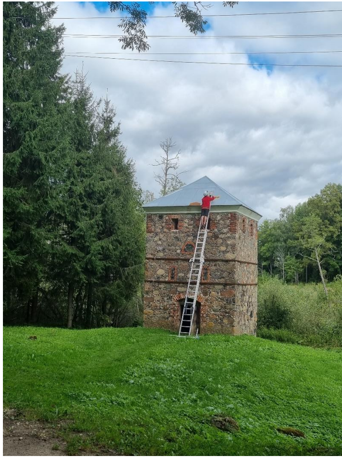
Pav. „FIXUS Mobilis“ Stelmužės dvaro sodybos pastato, vadinamas „Vergų bokštu“ priežiūros darbai