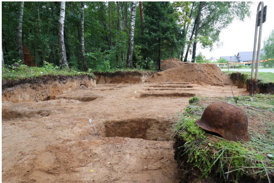
Pav. II-ojo pasaulinio karo vokiečių karių kapavietės Kunotų kaime (Zarasų r.) karių ekshumacijos darbai