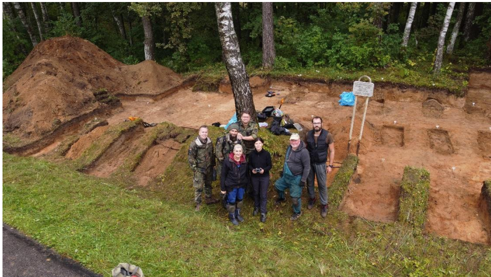
Pav. II-ojo pasaulinio karo vokiečių karių kapavietė Kunotų kaime (Zarasų r.). Ekshumacijos darbai