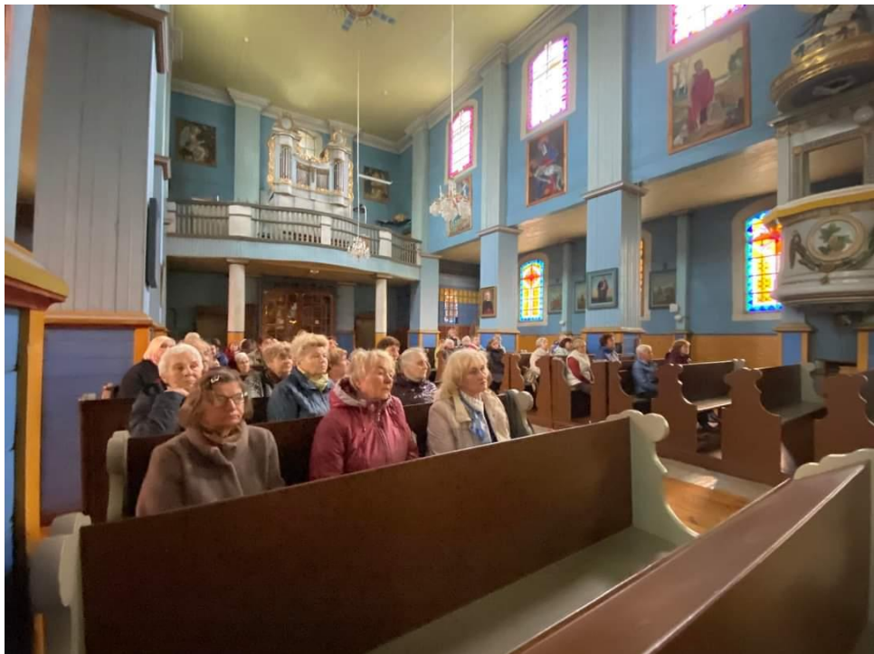
Pav. Europos paveldo dienos Antazavės Dievo Apvaizdos bažnyčioje