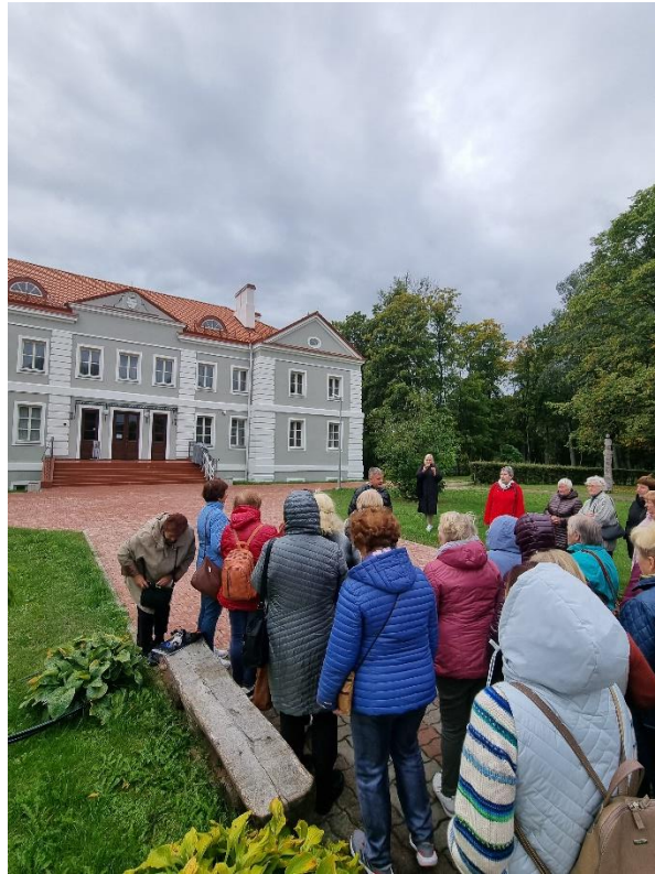
Pav. Europos paveldo dienos Antazavės dvare