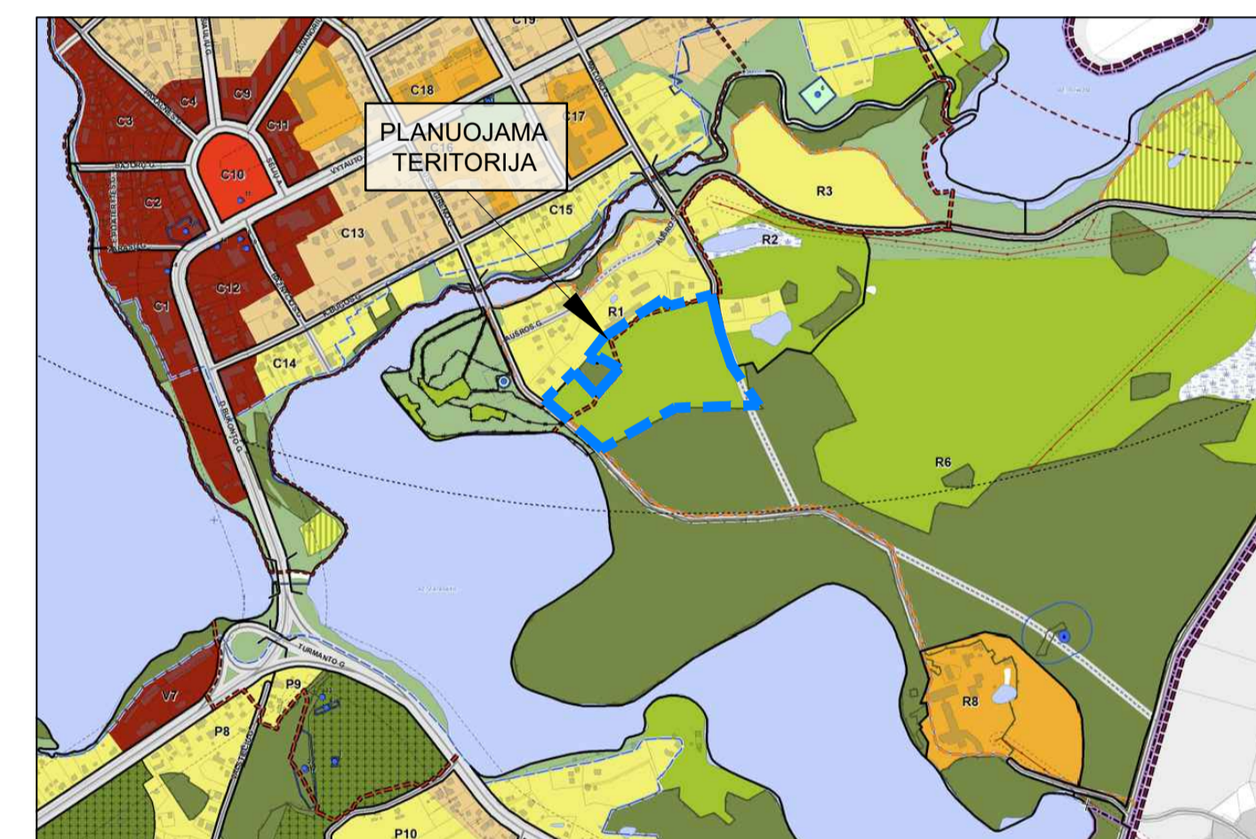
Planuojamos teritorijos situacija Zarasų miesto teritorijos bendrojo plano koregavimo Pagrindiniame (reglamentų) brėžinyje (T00085614)